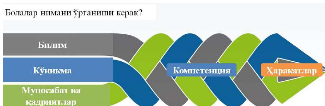
1.3.1-rasm. PISA dasturida baholash mezoni

PISA dasturida «baholash» o'quvchilarning hayotiy ko'nikmalarini, ya'ni maktab dasturi doirasida olgan bilimlarini hayotiy vaziyatlarda qo'llay olish darajasini aniqlashga qaratilgan. Bu esa o'z navbatida o'quvchidan funksional savodxonlikni talab etadi.